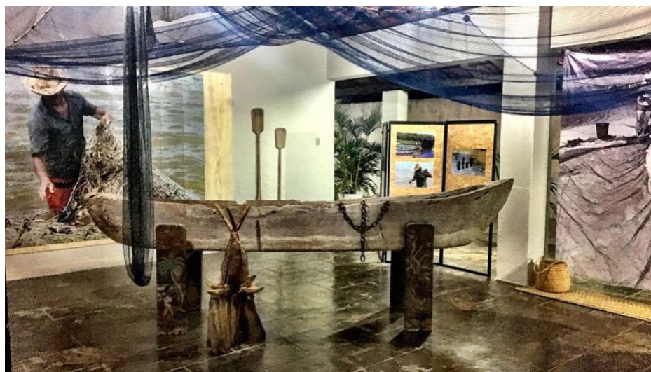
Exposição Por Entre Rio e Mar | Museu da Vila | 2018-2019

MINISTÉRIO DA EDUCAÇÃO UNIVERSIDADE FEDERAL DO PIAUÍ PRÓ-REITORIA DE ENSINO DE PÓS-GRADUAÇÃO UNIVERSIDADE FEDERAL DO DELTA DO PARNÁIBA PRÓ-REITORIA DE PÓS-GRADUAÇÃO, PESQUISA E INOVAÇÃO PROGRAMA DE PÓS-GRADUAÇÃO EM ARTES, PATRIMÔNIO E MUSEOLOGIA