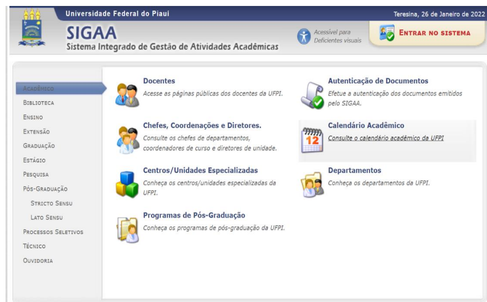
Figura 1: Tela Inicial do SIGAA.

O SIGAA é onde você irá submeter seus certificados digitalizados. É possível acessá-lo pelo endereço https://sigaa.ufpi.br/sigaa/public/home.jsf :