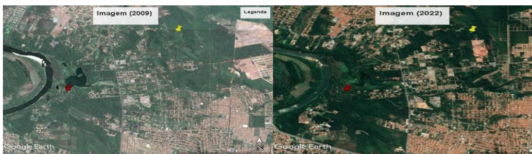
Figura 1 e 2 - Área entorno Bioparque Zoobotânico (Teresina-PI)

Fonte: Google Earth Pró , figura imagem 01 agosto 2009 e imagem 02 fevereiro de 2022