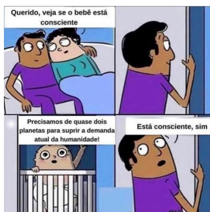
Figura 1 - Exemplo de meme a ser utilizado em aula de educação ambiental

Desta forma, fazer relação entre as configurações que nos levam à financeirização da vida e a revolução tecnológica com o esgotamento ambiental, é um meio de conscientizar e sensibilizar a comunidade escolar, assim como a sociedade em geral, promovendo o pensamento global a partir da reflexão e da promoção de visibilidade para essas questões. Assim, surge a proposta de uso de memes como recurso didático, pois são materiais acessíveis e com potencial para atingir um público diverso, de forma lúdica e cômica, como mostra o exemplo da Figura 1: