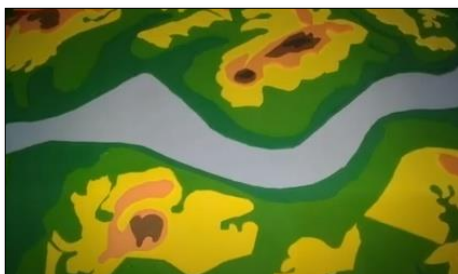
Figura 1 - Mapa tátil.

Durante sua produção, o mapa tátil (Figuras 01 e 2) deve ser acompanhado da explicação sobre as escalas altimétricas, suas variações de cores e a importância de estarem presentes na legenda e na composição do trabalho.