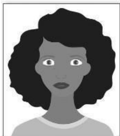
Figura 1. Modelo de Foto Frontal