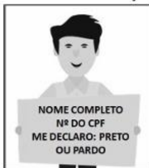
Figura 3. Modelo de Autodeclaração para o vídeo.

c) um vídeo individual recente, com no máximo 20MB (no formato MP4), que contenha de forma resumida sua autodeclaração, no qual o candidato deverá se apresentar segurando uma folha de papel A4 (29,7cm x 21,0cm), orientação paisagem, as seguintes informações: “nome completo do candidato”, “número do CPF”, me autodeclaro, “Preto ou Pardo, conforme o candidato” ; no vídeo o candidato deverá expressar 7 verbalmente (falar) a sua autodeclaração e deverá ser gravado com as seguintes características: