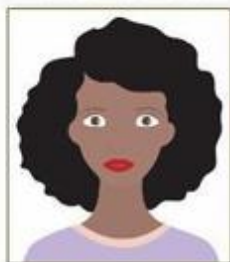
Figura 1. Modelo de Foto Frontal