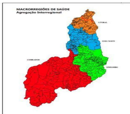
Figura 2. Macrorregiões de saúde, Piauí.