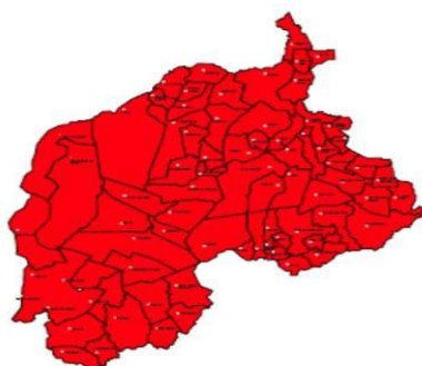
Figura 3. Macrorregião dos Cerrados, Piauí.