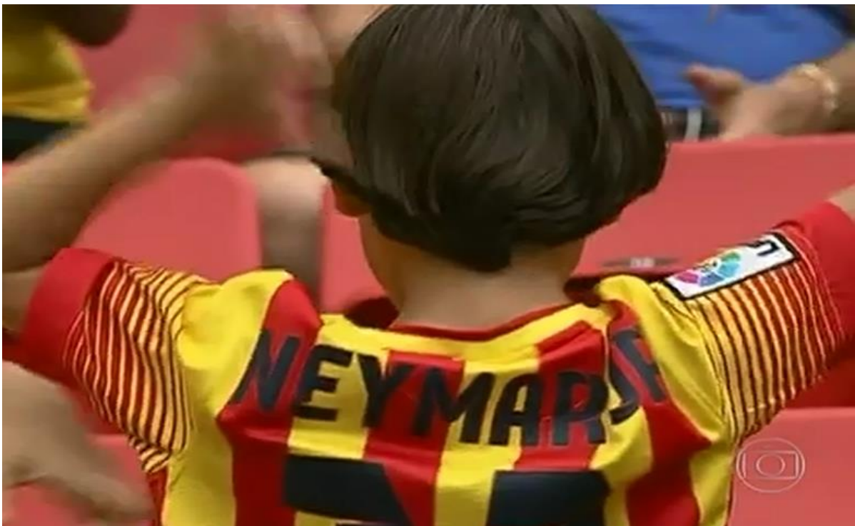
Figura 5. Criança exhibe para as câmeras camisa Barcelona FC com o nome de Neymar.

A mídia é uma instituição que tem como propósito social difundir informações. Conforme Charaudeau (2010, p. 19), “a informação é essencialmente uma questão de linguagem, e a linguagem não é transparente ao mundo, ela apresenta sua própria opacidade através da qual se constrói uma visão, um sentido particular do mundo”. A mídia passa informações, estimula a criação do imaginário e transmite elementos para interpretação do mundo muitas vezes definidos por interesses de mercado e audiência – dividindo espaço, assim, com a escola e a família na formação de valores – por meio de símbolos, palavras, gestos expressões e outros recursos de comunicação. Além disso, estamos inseridos em um capitalismo onde o que importa é o consumismo e o esporte-espetáculo colabora para que isso comece na infância. O discurso do EE pretende induzir as crianças – e conseqüentemente, os pais – ao consumo de produtos e à reprodução de hábitos relacionados a Neymar ao expor o ídolo como um ser humano especial, carinhoso, divertido, sincero. Várias crianças na reportagem reproduziram o visual de Neymar e/ou usaram uniformes e outros produtos relacionados ao jogador. Tal atitude foi vista pelo EE como um ato de “amor” pelo ídolo, porém também pode ser vista como uma tentativa de se igualar ou, pelo menos, compartilhar de algumas características dele.