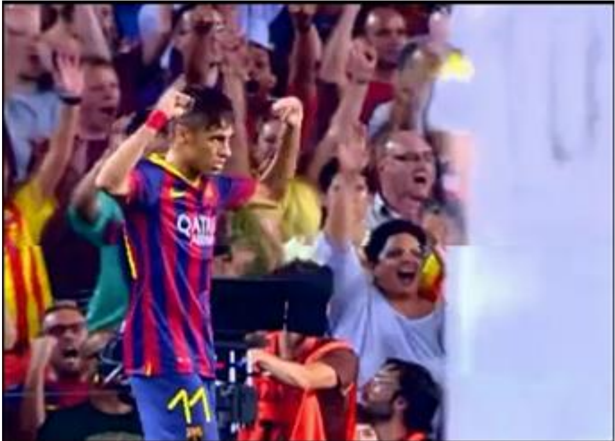
Figura 4. Vibração de Neymar e da torcida ao final da partida Barcelona X Santos.

consideração também a ideologia de quem emite e recebe os sentidos do texto que está sendo enunciado. Fez-se sentido, naquele momento, e dentro do contexto milionário e de vitórias, que Neymar passasse a ser reconhecido como craque e ídolo.