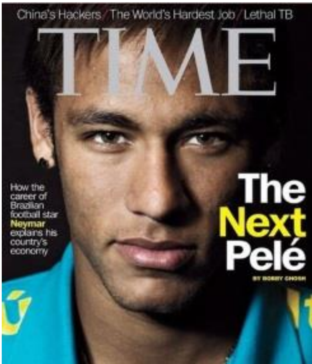
Figura 2. Neymar ilustra edição da revista Time.